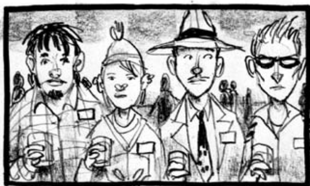
2 HALVNERT BILLEDE AF TEGNENØRDER