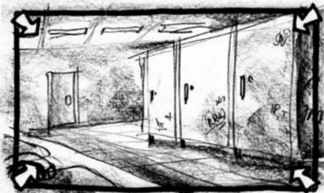
5 TOTALBILLEDE AF TOILETBÅSE LANGSOM TRACK IND MOD MIDTERSTE TOILETBÅS

NØRD: "Hvor mange film har du så lavet ind til nu?". VOICE-OVER: "Selv om Lars HAVDE fået lavet noget, ramte det sidste spørgsmål som en forhammer lige mellem øjnene".