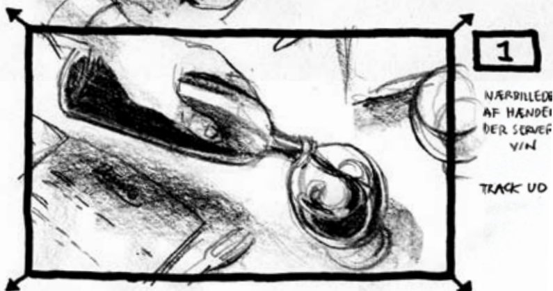
1 NÆRBILLEDE AF HÅNDENE DER SERVEF VIN TRACK UD