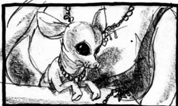
4 NÆRBILLEDE AF BARMEN CHIUAVA

EMIL: "Første skridt er at få en agent, som du har, og det er fedt. Men for at agenterne kan finde et job til dig, bliver man nødt til at være et navn i branchen. Du skal sgu' netværke opad!".